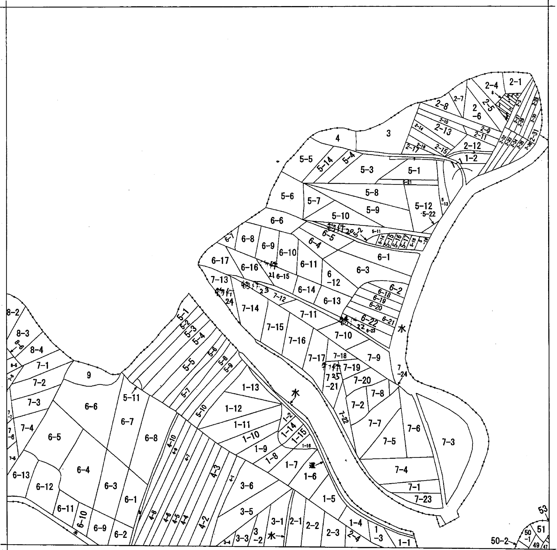
図 56 枚